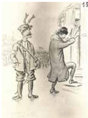
Caricatures de Provost, 1918. Membres du corps diplomatique et étrangers.