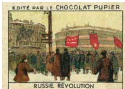
Chromolithographie Chocolat Pupier, 1932.

Ces journées d'étude sont organisées par les Archives diplomatiques, les Archives nationales et le Centre d'études des mondes russe, caucasien et centre européen [CERCEC].